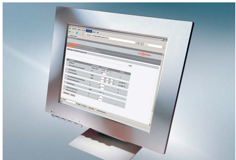
Klartextmeldung und einfache Bedienung, zum Beispiel über ein Smartphone/PDA oder einen PC

Jede Meldung, die Sie erhalten, ist im Klartext ausgeführt. Das heißt: Der Empfänger bekommt eine logische, einfach nachvollziehbare Information. Störungen werden direkt an den zuständigen Fachbetrieb per SMS oder Email weitergeleitet. Damit lassen sich Wartungs- und Servicetätigkeiten effizient durchführen.