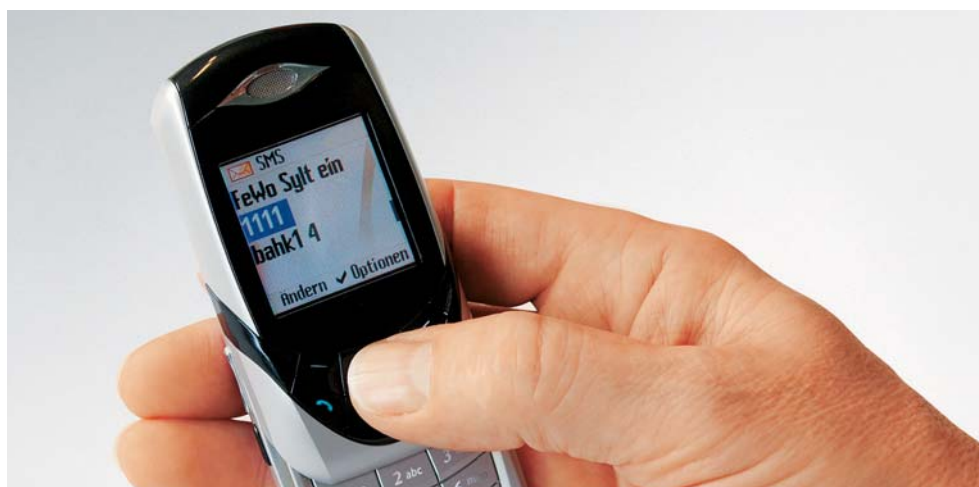
Wohlige Wärme bei Ankunft in Ihrer Ferienwohnung. Rufen Sie einfach Ihre Heizung an

Bei den Kosten schaltet Vitocom 100 auf Sparflamme. So fallen zum Beispiel keine laufenden, festen Betriebskosten an. Sie können das System über eine optionale SIM-Karte betreiben, den Mobilfunkanbieter frei wählen oder kostengünstige Pre-Paid-Cards einsetzen.