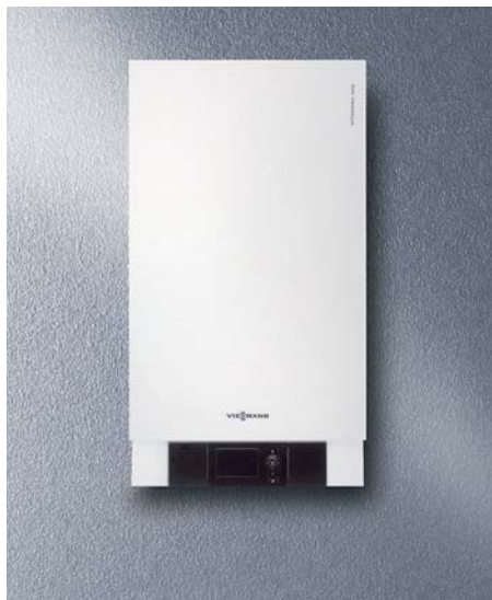
Der kompakte Gas-Brennwertkessel Vitodens 300-W braucht sich nicht zu verstecken und macht in jeder Umgebung eine gute Figur.