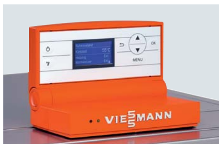
Vitotronic Regelung – einfache Bedienung dank intuitiver Menüführung