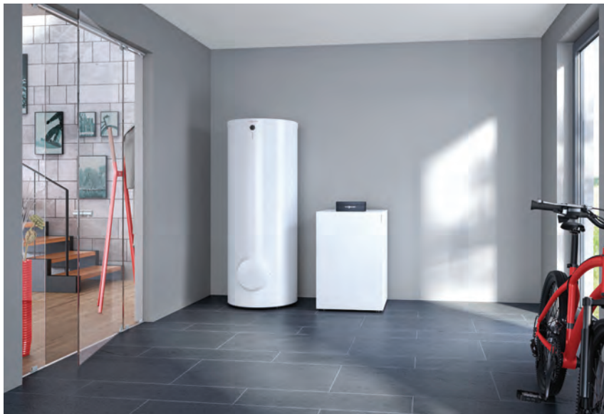
Wärmepumpe Vitocal 200-G mit Speicher-Wassererwärmer Vitocell 100-W (links)

Die preisattraktive Sole/Wasser-Wärmepumpe Vitocal 200-G ist dank ihres leisen Betriebs auch für die wohnraumnahe Aufstellung geeignet.