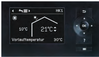
Display der Regelung Vitotronic 200 (Typ WO1C)