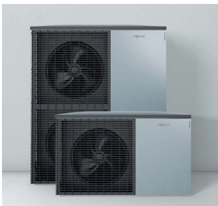
Neue Außeneinheiten im Viessmann Design – Made in Germany