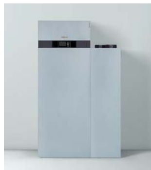
Vitocal 200-A mit Vitovent 300-F (rechts)

Besonders kostensparend geschieht dies mit selbst erzeugtem Strom aus einer Photovoltaik-Anlage. An Sommertagen produzieren die Solarmodule große Strommengen, die häufig im Haus nicht genutzt werden können und deshalb gegen eine nur geringe Vergütung in das öffentliche Netz eingespeist werden müssten. Dieser solare Überschuss-Strom lässt sich mit der Vitocal 200-A zum Betrieb der Umwälzpumpen für die Gebäudekühlung selbst nutzen.