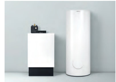
Vitoladens 300-C mit nebengestelltem Speicher-Wassererwärmer Vitozell 300-B/W (Typ EVBB-A, 300 l Speicherinhalt) – beide in der Farbe Vitoppearlwhite

Zu einer modernen Heizungsanlage gehört auch innovative Solartechnik zur Nutzung kostenloser Sonnenenergie. Viessmann bietet dafür ein auf den Vitoladens 300-C abgestimmtes System.