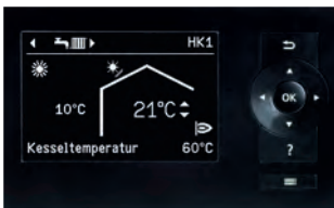
Display der Vitotronic Regelung mit Klartextanzeige und übersichtlicher Menüführung

Mit Vitoconnect und einem Smartphone ist die Bedienung von Viessmann Heizungsanlagen ein Kinderspiel. Mit der ViCare App können Heizungsanlagen gesteuert werden. Alle Apps sind für mobile Endgeräte mit iOS- oder Android-Betriebssystemen erhältlich.