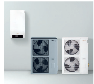
Inneneinheit Vitocal 250-S mit den Außeneinheiten in Vitosilber und Weiß

*2 Energieeffizienzklasse nach EU-Verordnung Nr. 811/2013 Heizen, durchschnittliche Klimaverhältnisse Niedertemperaturanwendung LT (35 °C)/Mitteltemperaturanwendung MT (55 °C)