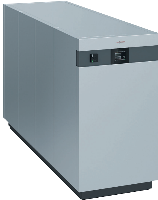
Vitocal 3350-HT Pro Nenn-Wärmeleistung Sole/Wasser: 56,6 bis 144,9 kW (B0/W35) Nenn-Wärmeleistung Wasser/Wasser: 148 bis 390 kW (W50/W90)

Regenerative Wärme für gewerbliche Einsätze wird durch den Bedarf an hohen Vorlauftemperaturen bestimmt.