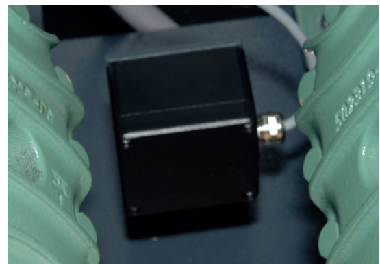
Automatische Dichtigkeitsüberwachung Gasdetektor

Mit dem neuen HFO-Kältemittel R1234ze erfüllt die Baureihe bereits heute Kältemittelanforderungen, die weit über 2020 hinaus gelten. Das GWP (Global Warming Potential) ist im einstelligen Bereich und damit natürlichen Kältemitteln fast gleichzusetzen.