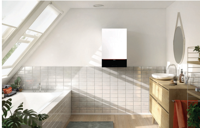
Vitodens 200-W mit attraktivem Design in der Farbe Vitopearlwhite

Vitodens 200-W ist das ideale Gas-Brennwert-Wandgerät für die Eigentumswohnung oder das Einfamilienwohnhaus. Es lässt sich problemlos in einer Nische im Badezimmer oder in einem Küchenschrank montieren. Vitodens 200-W ist mit einem Inox-Radial-Wärmetauscher aus hochwertigem Edelstahl ausgerüstet. Er garantiert Zuverlässigkeit und eine dauerhaft hohe Brennwertnutzung. Das gilt auch für den Matrix-Plus-Brenner.