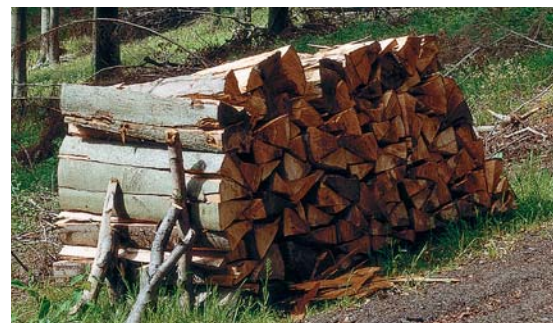
Heizen mit Holz – der natürlichste Brennstoff der Welt

Bereits nach wenigen Minuten ist der Anheizvorgang abgeschlossen. Im Füllraum werden die Holzscheite durch reduzierte Sauerstoffzufuhr lediglich durchgeglüht. Das zündfähige Holzgas verbrennt anschließend bei Zufuhr von Sekundärluft sauber bei hohen Temperaturen. Durch das stufenlose, drehzahlgeregelte Abgasgebläse können Voll- und Teillast zuverlässig geregelt werden. Zum Zünden des Brennstoffes ist optional eine automatische Zündung erhältlich. Über die Regelung kann der gewünschte Zündzeitpunkt auch programmiert werden.