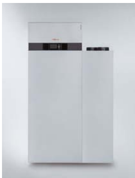
Vitocal 200-A mit Vitovent 300-F