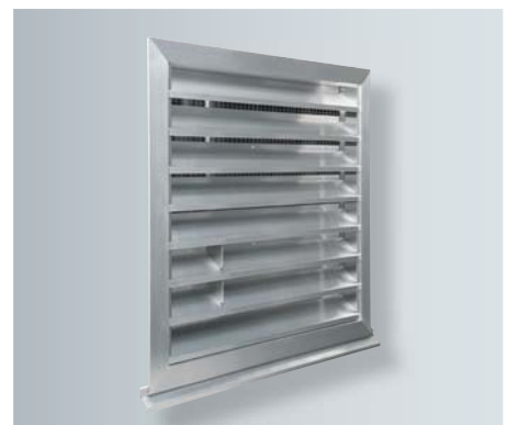
Aufgeräumte Optik an der Fassade (dargestellt: Zuluftseite der Wärmepumpe)

Die Systemkombination steht in zwei Leistungsgrößen zur Verfügung. Das als Zubehör angebotene flexible Kunststoff-Flachkanalsystem gewährleistet eine schnelle, einfache und ganz individuelle Anpassung der gesamten Lüftungsanlage an die bauseitigen Gegebenheiten.