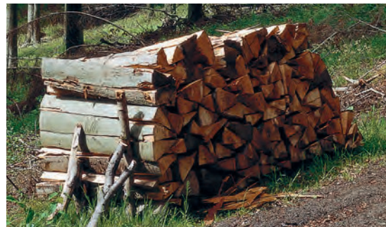
Heizen mit Holz – der natürlichste Brennstoff der Welt

Bereits nach wenigen Minuten ist der Anheizvorgang abgeschlossen. Im Füllraum werden die Holzscheite durch reduzierte Sauerstoffzufuhr lediglich durchgeglüht. Das zündfähige Holzgas verbrennt anschließend bei Zufuhr von Sekundärluft sauber bei hohen Temperaturen. Durch das stufenlose, drehzahlgeregelte Abgasgebläse können Voll- und Teillast zuverlässig geregelt werden. Zum Zünden des Brennstoffes ist optional eine automatische Zündung erhältlich. Über die Regelung kann der gewünschte Zündzeitpunkt auch programmiert werden.