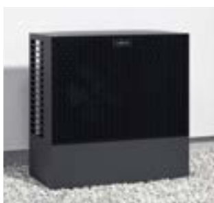
Außeneinheit der Vitocal 222-S mit Design-Bodenkonsole