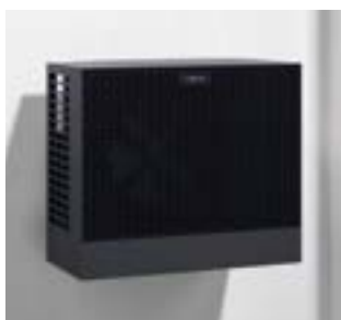
Außeneinheit der Vitocal 222-S mit Design-Wandkonsole