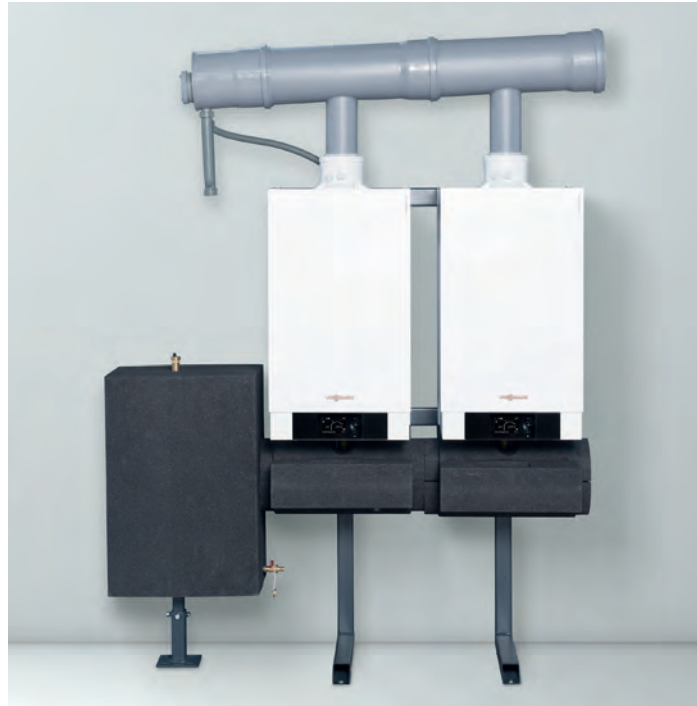
Komplett vormontierte Kaskadenmodule für die Wand oder die freistehende Montage, als Reihen- und Blockaufstellung

Das Vitodens 200-W Gas-Brennwert-Wandgerät ist für den Einsatz in Mehrfamilienhäusern, gewerblichen Bauten und öffentlichen Einrichtungen bestens geeignet. Der von Viessmann entwickelte und gefertigte Heizkessel ist in dieser Art weltweit einzigartig. Als modulares Kaskadensystem ist er nicht nur kostengünstig, er bietet auch platzsparende Lösungen. Es lassen sich Kaskaden mit einer Nenn-Wärmeleistung von zweimal 49 kW bis sechsmal 99 kW auch in niedrigen Räumen von 1,9 Meter Deckenhöhe kombinieren.