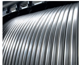
Inox-Radial-Wärmetauscher aus Edelstahl

Edelstahl macht den Unterschied. Der korrosionsbeständige Inox-Radial-Wärmetauscher aus Edelstahl ist das Herzstück des Vitodens 200-W. Er wandelt die eingesetzte Energie besonders effizient in Wärme um. Praktisch verlustfrei, mit einem kaum zu übertreffenden Wirkungsgrad von 98 Prozent. Und das mit der Sicherheit des besonders langlebigen, hochwertigen Edelstahls.