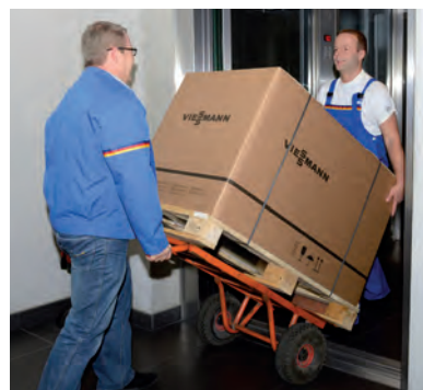
Einfacher Transport, auch in Heizzentralen auf dem Dach

Mit dem Vitodens 200-W entsteht so eine effiziente Heizungsanlage mit einem hohen Heiz- und Trinkwasserkomfort, die sich besonders zur Modernisierung bei gewerblichen Anwendungen anbietet.