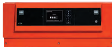
Kaskadenregelung Vitotronic 300-K

Für die Regelung der Kaskade steht die neue Vitotronic 300-K zur Verfügung. Die Klartextanzeige mit grafischer Unterstützung bietet einen hohen Bedienkomfort. Auf Wunsch kann die Heizungsanlage über Vitogate 200 auch in Gebäudeautomationsysteme eingebunden werden.